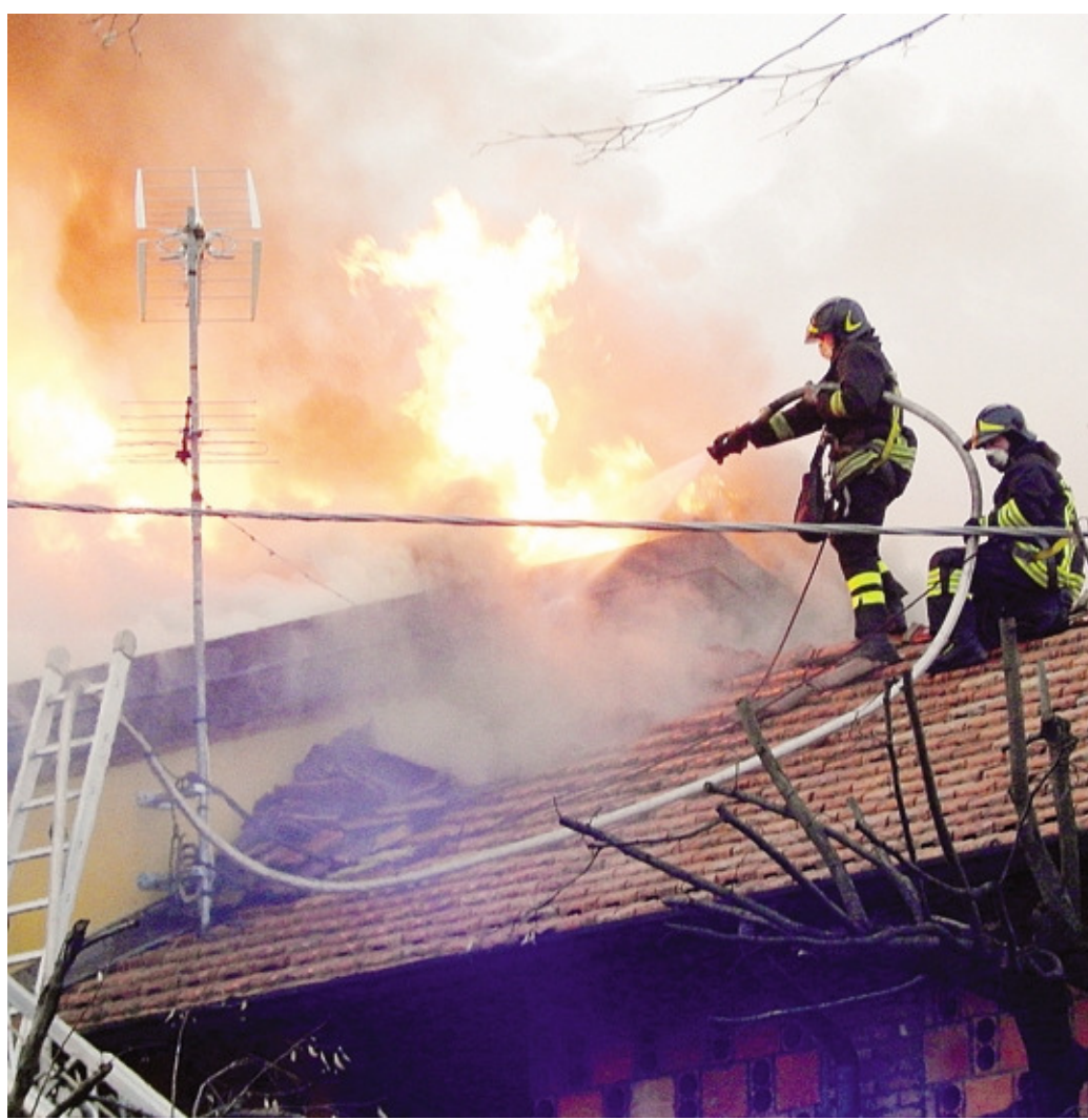
Tre ore di lavoro per i vigili del fuoco che ieri hanno spento il rogo alla Cascina Sant'Agnesa a Palazzago